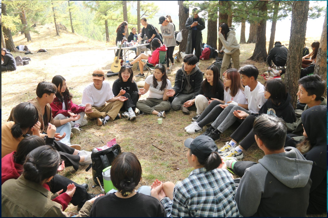
“2022 оны намрын танилцах өдөрлөг”